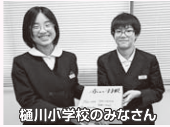
樋川小学校のみなさん