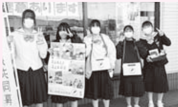
10/10ちゃんじで街頭募金を行った 宝達中学校JRC部のみなさん