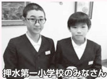
押水第一小学校のみなさん