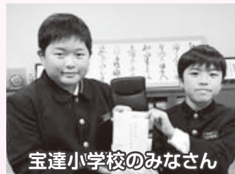
宝達小学校のみなさん