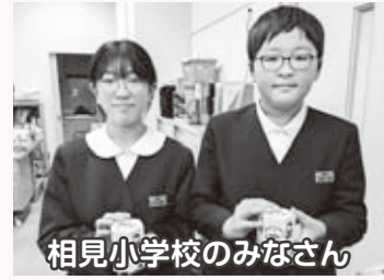
相見小学校のみなさん

昨年10月1日から12月31日までの3か月間にわたり、赤い羽根共同募金運動を実施しました。区長さんをはじめとした区民の皆様、町内の小中学校及び高等学校の生徒さんによる学校募金等、多くの方々のご協力により、たくさんの募金が寄せられています。最終的な募金の額はただ今集計中ですので、次号の本誌（4月発行予定）にてご報告いたします。今回は募金に協力してくれた町内学校の皆さんの活動を紹介します。