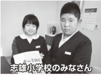
志雄小学校のみなさん