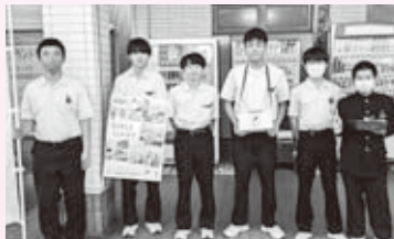
10/21業務スーパーで街頭募金を行った 宝達高校生徒会のみなさん