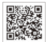
公式フェイスブック