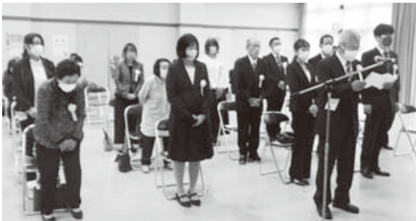
▲今大会で受賞されたみなさま