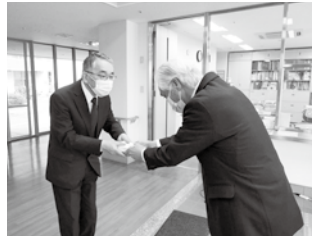
↑「施設入所の方へお渡しください」と見舞金贈呈の様子 宝達苑玄関にて

昨年12月1日から31日までの1か月、皆さんからの封筒募金や企業からの企業募金等、たくさんのご協力をいただきました。詳細は、次号でご報告いたします。この募金は民生委員の協力を得て、町内出身者で施設入所されている方への見舞金や在宅で介護をされているご世帯への介護慰労金として贈呈しています。